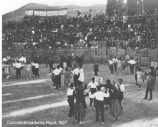
Concurs de sardanes, Ripoll, 1927

La sardana una dansa pel món Els Amigos La casa de menjars de Ripoll Tel. 972 70 00 09