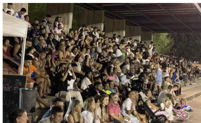
El gran ambient a la graderia del camp municipal d'esports de Ripoll.