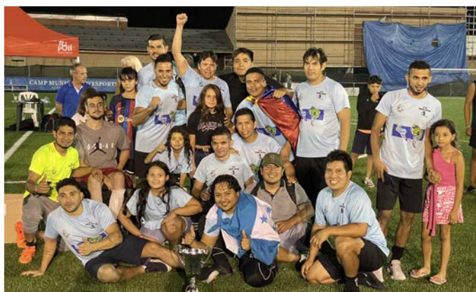
Unión Latina, campions veterans.