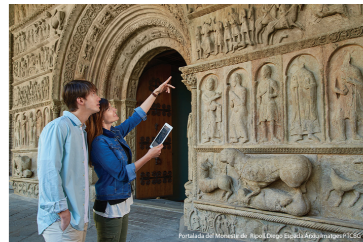
Portalada del Monestir de Ripoll. Diego Espada. Arxiu d'imatges PTCBG

http://www.viesverdes.cat/rutes_vies_verdes/ruta-del-ferro-i-del-carbo/