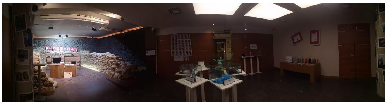
Exposició "Emociona't" al Museu Etnogràfic de Ripoll

El passat 6 i 7 de juliol, la Fundació Carulla va organitzar les jornades Mutare "Cultura contra l'emergència emocional", a la Nau Bostik de Barcelona, en les quals l'Escola Vedruna i el Museu Etnogràfic, hi van participar presentant el projecte "Emociona't".