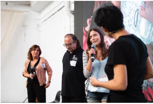
Presentant Emociona't al Mutare

El segon projecte s'anomena "El museu al carrer" . El seu producte final era crear un escenari de l'aplicació MHM (Mobile History Map) i geolocalitzar objectes del Museu Etnogràfic al seu lloc d'origen.